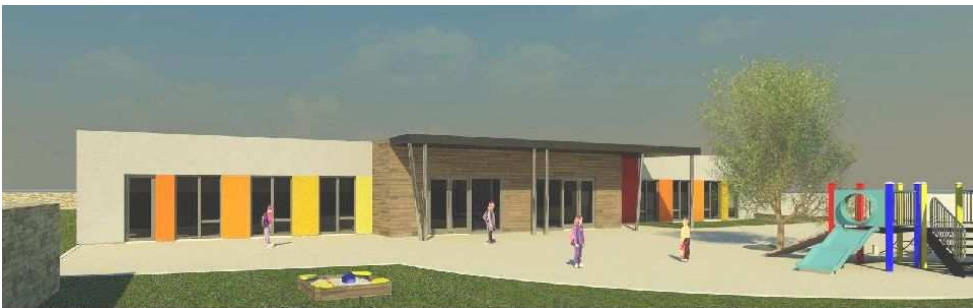
Perspectives proposées par le cabinet AZ Architectes.

Le permis de construire des futurs bâtiments scolaires a été déposé au mois de juillet 2011. Une grande partie des bâtiments existants sera conservée mais une réorganisation de l'utilisation des locaux va être nécessaire afin de créer une cohérence entre les trois corps de bâtiments (école actuelle, ancienne mairie et nouveau bâtiment). Nous espérons inaugurer ces locaux en septembre 2012.